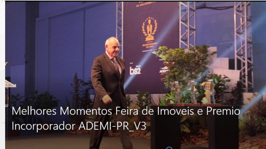
Melhores Momentos Feira de Imoveis e Premio Incorporador ADEMI-PR_V3